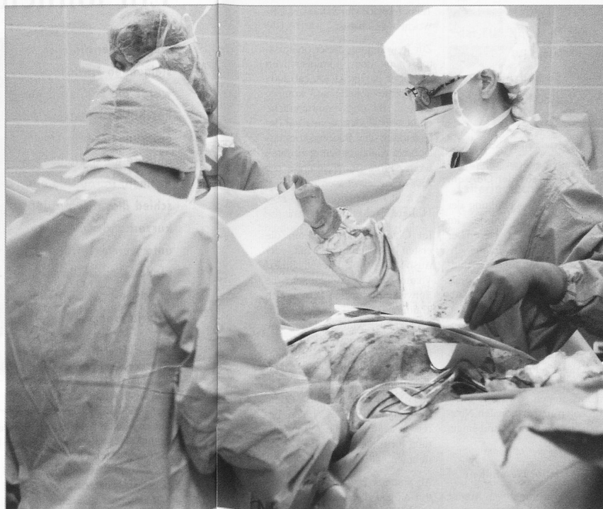
Die Aufenthalte von älteren Patientinnen und Patienten im Akutspital sollen dank einer Übergangspflege weiter verkürzt werden.

Zielgruppe sind vorwie- gend ältere Menschen, die nach einem Spitalauf- enthalt pflegerisch-thera- peutische Massnahmen zur Wiedererlangung ihrer Selbstständigkeit benötigen, bevor sie wieder nach Hause entlassen werden können. Es berichtet Beat Demarmels, Leiter Heime und Alterssiedlungen der Stadt Luzern.