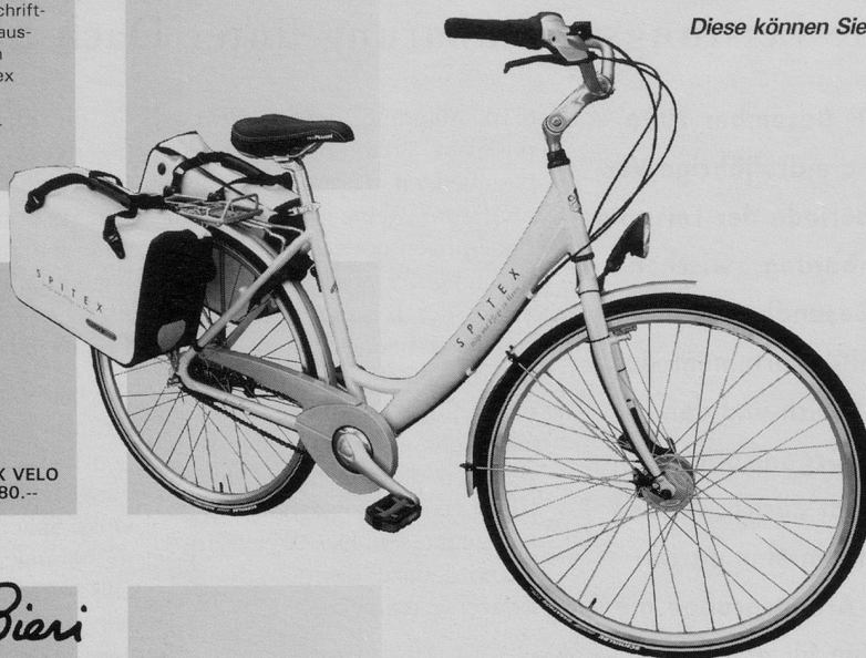
SPITEX VELO CHF 980.--

Mit den Spitexorganisationen der Städte Bern und Zürich haben wir für Sie bedürfnisorientierte Spitex-Artikel entwickelt.