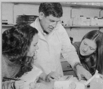
Bereits gehören zahlreiche Betriebe der Oda an.

Mit Blick auf die zukünftigen Anforderungen im Bereich der Ent-