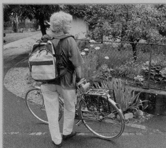
Bei den Stellen liegt Schaffhausen unter dem Durchschnitt.

Diese Tendenz bestätigt sich auch bei den Pflegequoten. Bei der