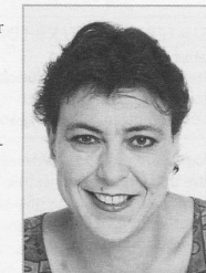
Christine Goll, Präsidentin vpod und Nationalrätin

Die Spitex-Mitarbeitenden brauchen Mut und Kraft, um sich in der Praxis für ein soziales, solidarisches und gerechtes Gesundheitssystem mit guten Spitex-Leistungen einzusetzen. Sie brauchen aber auch die Gewissheit, dass die Bevölkerung hinter ihnen steht, wenn ihre Rechte angegriffen werden. Die Interessen der Arbeitnehmenden und Arbeitnehmer sind immer auch die Interessen der Bürgerinnen und Bürger. Auch deshalb hat die Spitex Zukunft.