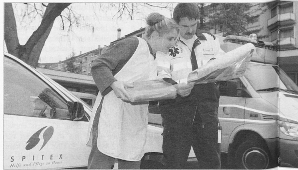
Spitexpress – ein stabiles, hochmotiviertes und engagiertes Team.

Der Spitexpress hat die Vorgabe, in maximal 30 Minuten nach Aufgebot durch die Notrufzentrale bei der hilfesuchenden Person zu sein. Meist steht ein Telefonanruf an erster Stelle der Kontaktaufnahme, bei dem abgeklärt wird, ob ein Einsatz vor Ort notwendig und der Zugang zur Wohnung gewährleistet ist. Rückt der Spitexpress aus, meldet er sich nach vollbrachter Arbeit bei der Mitarbeiterin der Notrufzentrale zu-