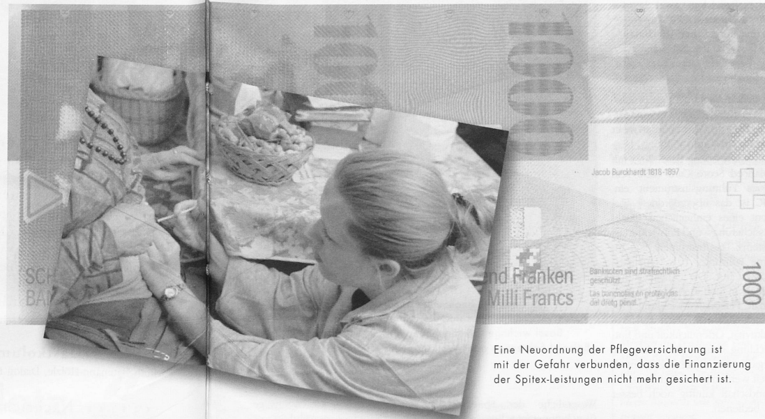
Eine Neuordnung der Pflegeversicherung ist mit der Gefahr verbunden, dass die Finanzierung der Spitex-Leistungen nicht mehr gesichert ist.

Grundsätzlich gilt gemäss KVG die Vollkostenpflicht. Das heisst, dass die Krankenversicherer bei transparenter Rechnungslegung die vollen Pflegekosten zu übernehmen haben. Ein Abrücken von dieser Position, also beispielsweise ein nicht kostendeckendes Beitragssystem, hat die Konsequenz, dass die Leistungsbezüger vermehrt zur Kasse gebeten werden. Dies bedeutet wiederum, dass weniger Spitex-Leistungen in Anspruch genommen werden. Es ist also eine starke Reaktion auf der Mengenseite zu erwarten. Zudem warten die kommerziellen Anbieter mit in-