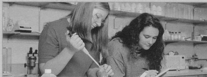
In der Spitex Uri wird die FaGe-Ausbildung als grosse Chance betrachtet.

(hw) Nichts ist so konstant wie die Veränderung – ein Leitsatz, der im Spitex-Bereich Bestätigung findet. Für die Existenzsicherung der Spitex ist eine Professionalisierung unumgänglich. Diese kann nur erreicht werden, wenn der momentane Status erfasst ist und die nötigen Schritte damit erkennbar werden. Dies wiederum bedeutet für die Basisorganisationen konkret, dass viele Umfragen beantwortet werden müssen. Der Geschäftsstelle des SKL