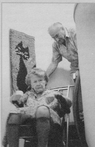
Regelmässige Entlastung schützt pflegende Angehörige vor Überforderung.

Die neue Telefonnummer für den Entlastungsdienst, 0848 480 800, ist erst ab dem 1. Mai in Betrieb. Die drei Organisationen wollen den Entlastungsdienst dem Bedarf entsprechend weiter entwickeln und ausbauen. Die Einsatzleitung für Betreuende von Demenzerkrankten erfolgt durch die Pro Senectute, für alle andern betreuenden Angehörigen übernimmt das SRK-Schaffhausen die Einsatzkoordination. Die Kosten für die Angehörigen betragen pro halben Tag 58 Franken, jede weitere Stunde kostet 25 Franken. Bei finanziellen Engpässen wird den Betroffenen eine Beratungsstelle