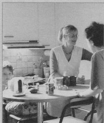
Der Anteil an hauswirtschaftlichen Arbeiten ist leicht gesunken, während die Pflegeleistungen weiter zugenommen haben.

Die 45 gemeinnützigen Spitex-Organisationen des Kantons Luzern betreuten 2002 insgesamt