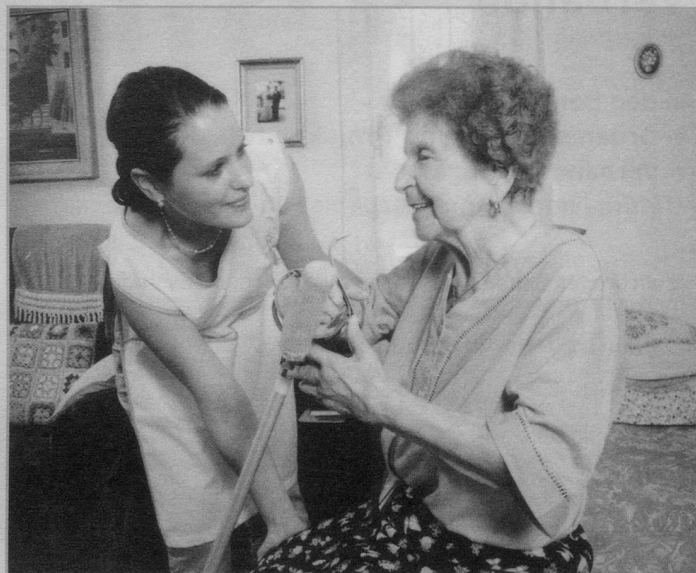
Wegen der prekären Lehrstellen-Situation im Kanton Zürich werden anstelle der ursprünglich geplanten vier FAGE-Klassen im Sommer 2003 neu sechs Klassen geführt werden.

Die Reorganisation der Berufsbildung der Gesund- heitsberufe im Kanton Zürich läuft auf vollen Touren. Im Sommer sollen die ersten FAGE-Lehrlinge mit der Ausbildung star- ten.