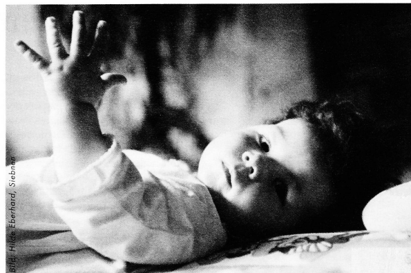
Die Kinderspitex als Teil einer notwendigen Spezialisierung in der ambulanten Pflege?