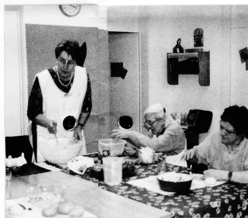
Das Tagesheim der Spitex – die Angehörigen werden entlastet.

Am Rosenbergweg in St. Gallen befindet sich ein Spitex-Stützpunkt, ein Ambulatorium und ein Tagesheim – alles unter einem Dach und zentral geführt. Diese Pionierleistung heisst Spitex Notker.