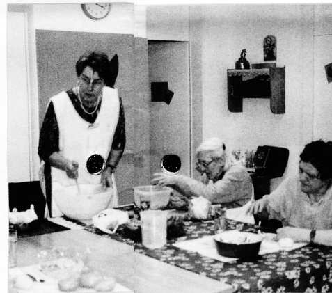
Das Tagesheim der Spitex – die Angehörigen werden entlastet.

Aber zuerst einmal gilt es, sich zu beeilen, um rechtzeitig zum Mittagessen im Notker-Stübli zu sein. Denn die Suppe, die dort mit viel Initiative gekocht wird, darf weder anbrennen noch kalt werden. □