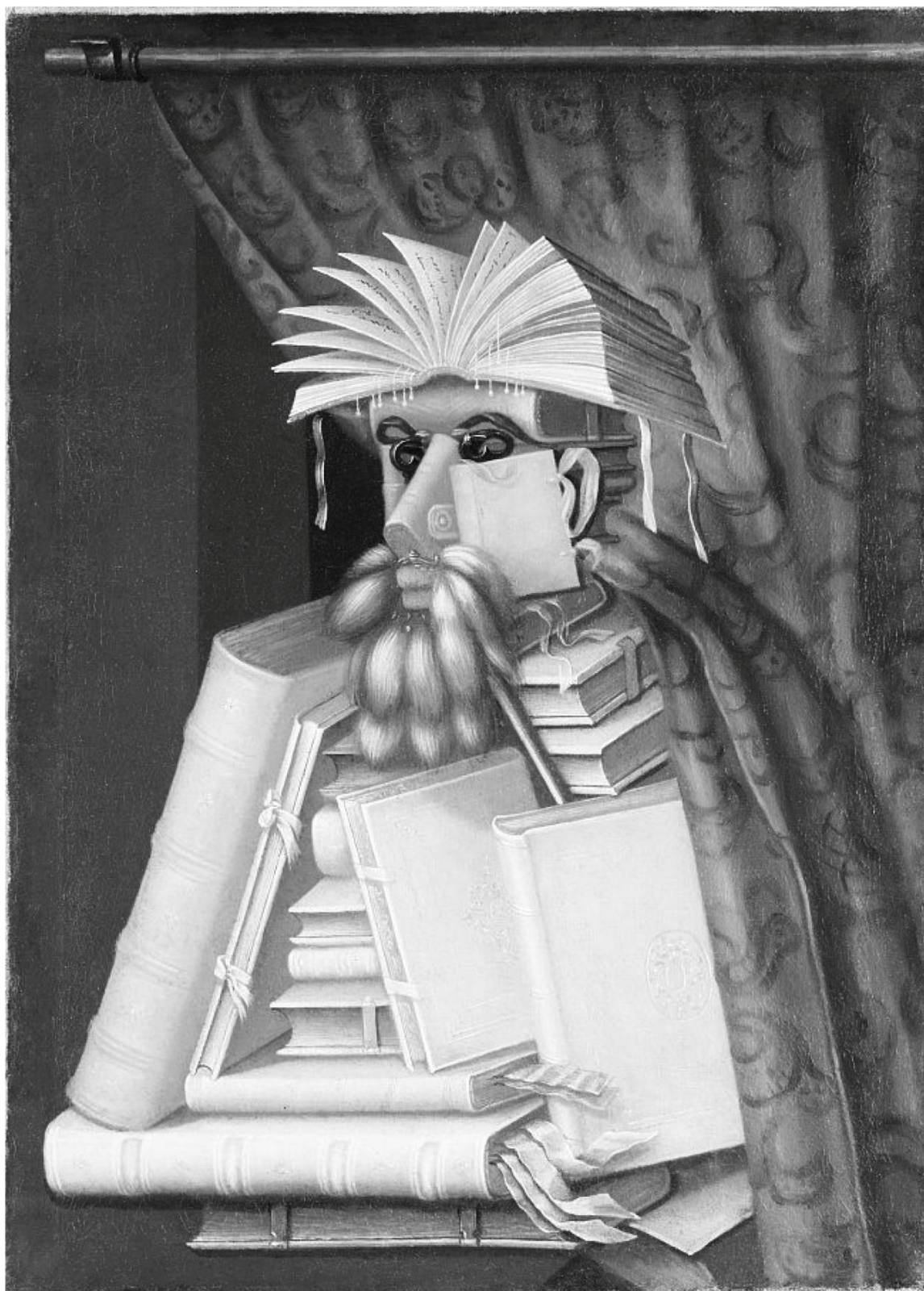
Giuseppe Arcimboldo (1527–1593): Der Bibliothekar. Der italienische Maler, der gern mit Fremdkörpern Porträts gestaltete, hat wohl Wolfgang Lazius (1514–1565) abgebildet, kaiserlicher Leibarzt und Konservator. Das Gemälde wurde 1648 von den schwedischen Truppen als Kriegsbeute aus Prag mitgenommen und hängt heute im Schlossmuseum Skokloster (Farbbild, ©: tiny.cc/Skokloster ).