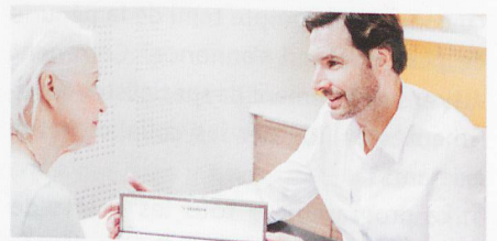
L'audioprothésiste devient un accompagnant fidèle sur le chemin qui mène à une meilleure audition.