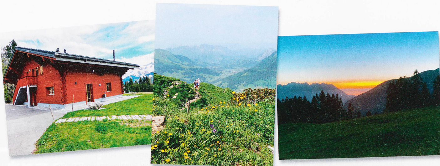
Les vacanciers gardent de merveilleux souvenirs de leur séjour à Villars-sur-Ollon: comme ceux du chalet «Le Petit Chevrier», de leurs longues randonnées ou de la vue au soleil couchant.

contraire, j'ai progressé et j'ai appris à conduire un bus», sourit la Zurichoise.