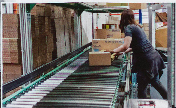
Une fois tous les produits collectés, la commande est prête à être expédiée.