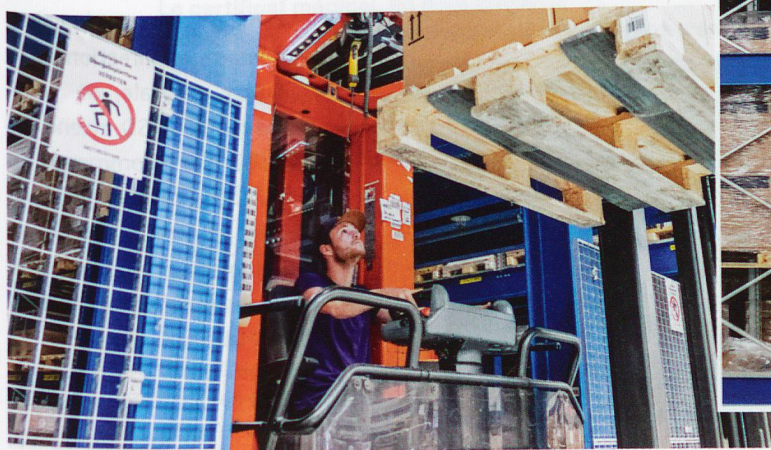
Quand des organisations d'ASD commandent des produits, les employés de Cosanum les récupèrent sur les énormes étagères.