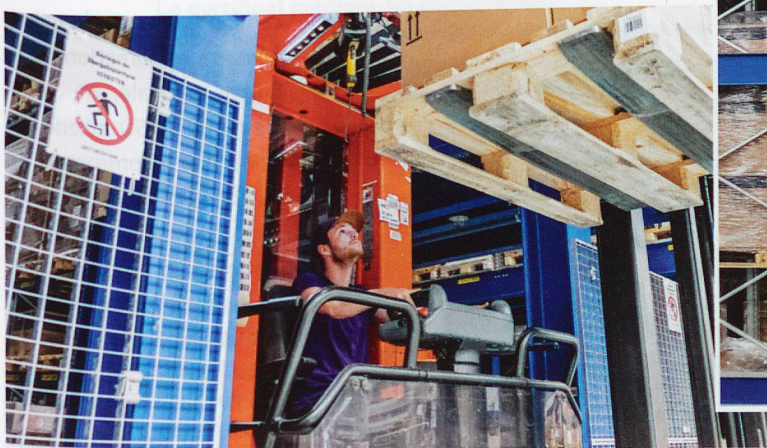
Quand des organisations d'ASD commandent des produits, les employés de Cosanum les récupèrent sur les énormes étagères.