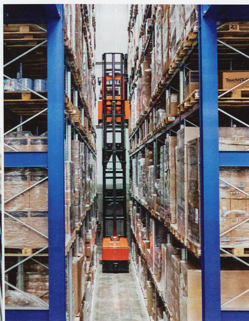
Les produits livrés sont ensuite stockés dans un immense entrepôt au moyen d'un chariot à haute levée.