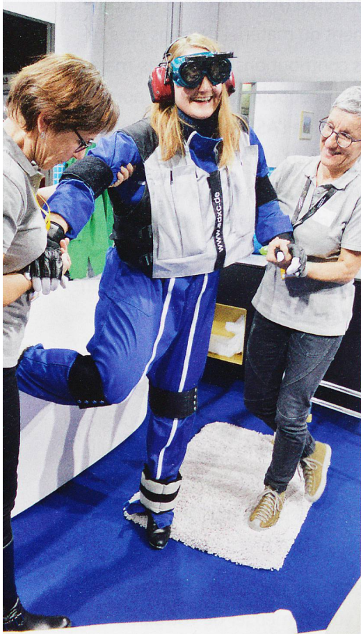
Le simulateur de vieillissement pèse lourd et entrave les mouvements.

Le salon Planète Santé s'est déroulé pour la première fois au CERM de Martigny, du 14 au 17 novembre. Cette édition a suscité un vaste engouement: elle a attiré 33 000 visiteurs. La rédaction y est allée.