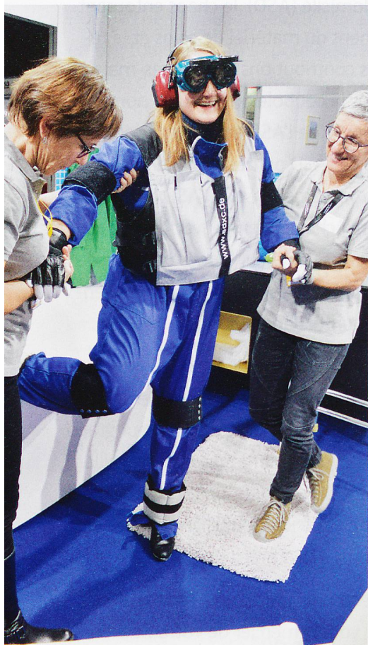
Le simulateur de vieillissement pèse lourd et entrave les mouvements.

Le salon Planète Santé s'est déroulé pour la première fois au CERM de Martigny, du 14 au 17 novembre. Cette édition a suscité un vaste engouement: elle a attiré 33 000 visiteurs. La rédaction y est allée.