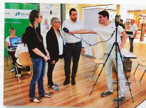
En Haut-Valais, l'intérêt médiatique a été grand.

En Valais, la manifestation a eu lieu le 14 septembre. Le centre médico-social (CMS) du Haut-Valais a offert aux visiteurs du centre commercial Simplon Center, à Glis, la possibilité d'interagir sur le thème «Entendre et écouter», en collaboration avec Neuroth et le groupement d'intérêts des malentendants du Haut-Valais. En plus d'un quiz sur le bruit, le public a pu prendre part à une version revisitée de «Qui veut gagner des millions?» comprenant des questions en lien avec la Journée nationale de l'ASD. Ils ont également pu s'exercer à la lecture labiale et tenter de mémoriser l'alphabet du langage des signes. Ici aussi, des tests auditifs ont été offerts. Partout où des organisations d'ASD ont mis en place des activités, le bilan est positif. Elles en ont profité pour faire entendre leurs préoccupations – et elles ont été écoutées par de nombreux représentants des médias.