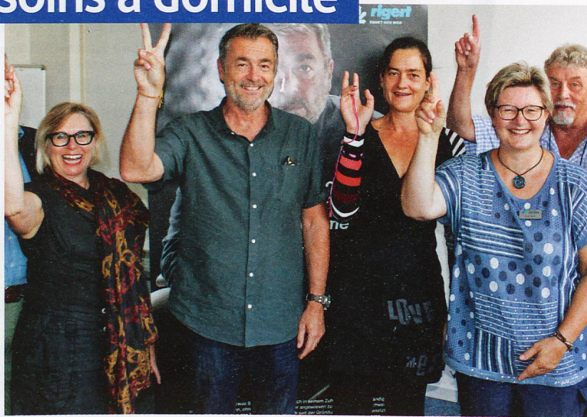
Stefan Gubser (2 e à g.) a rendu visite aux employés de l'organisation d'Aide et soins à domicile de la région de Soleure.