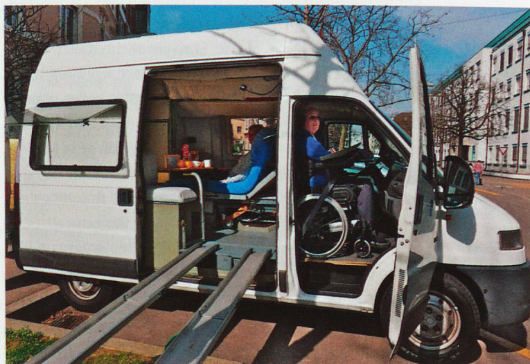
Avec des amis, Niggi Bräuning a aménagé le bus familial de manière à ce qu'il contienne tout le nécessaire pour les soins de sa femme paralysée.