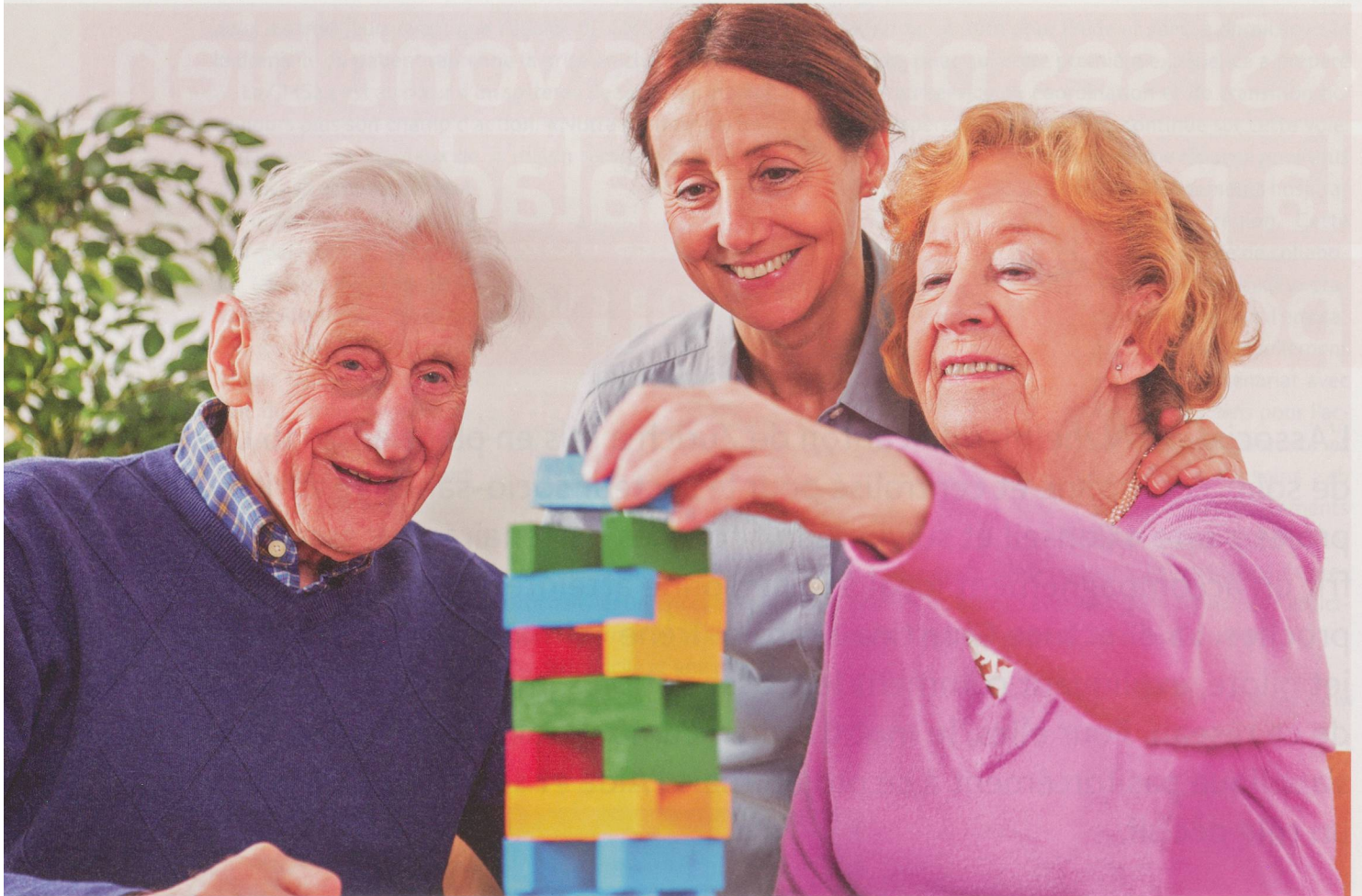
Une conseillère offre son expertise pour former un réseau autour de la personne malade et ses proches.

IT: D'autres outils scientifiques nous aident à prendre des décisions. Au moyen d'un questionnaire, il est possible de cerner ce qui décourage, dérange et pèse sur le quotidien d'un proche aidant. Est-ce le comportement agressif de la personne démente ou alors un manque de temps pour soi? Le proche aidant a-t-il besoin d'un groupe de parole qui puisse lui donner des conseils sur le long terme ou est-ce qu'un soutien et des soins lui sont immédiatement nécessaires?