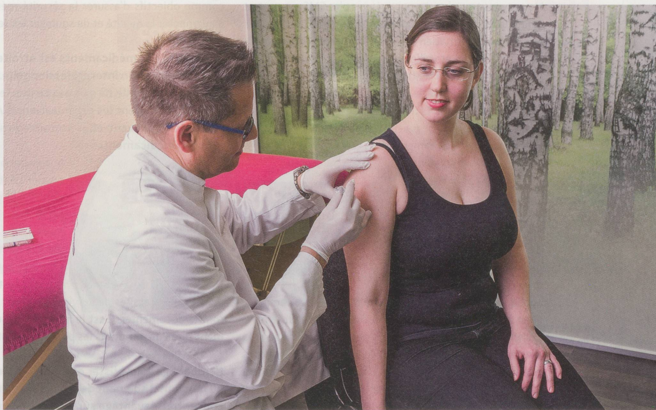
Les pharmacies proposent aujourd'hui une large panoplie de prestations.

Nous réalisons vos projets d'ameublement selon vos exigences et vos souhaits aux