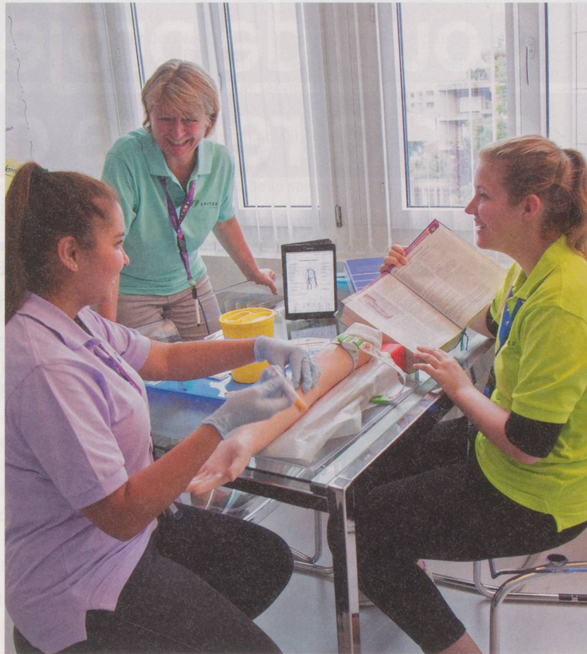
Une situation de formation courante: de nombreuses organisations d'ASD mettent un point d'honneur à former la relève.