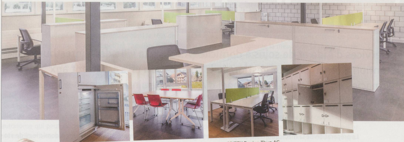
iba en collaboration avec Haworth : projet SPITEX Region Thun AG