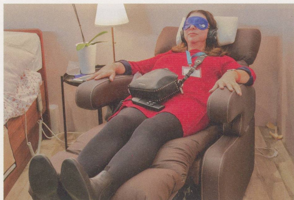
L'innovation pourrait contribuer au bien-être des soignants, mais aussi des soignés.

personnalisé, agréable et familier. L'idée? Renforcer l'autonomie et la sécurité de la personne en convalescence au moyen de la technologie. Son suivi se ferait par la collecte de données en temps réel (poids, tension, saturation de l'oxygène dans le sang, nombre de pas, qualité de l'air de la chambre, etc.). En cas de besoin, elle pourrait contacter son médecin pour une consultation en vidéo-conférence. Ses chaussures seraient en outre pourvues d'un système qui enverrait une alerte géolocalisée à ses proches en cas de chute.