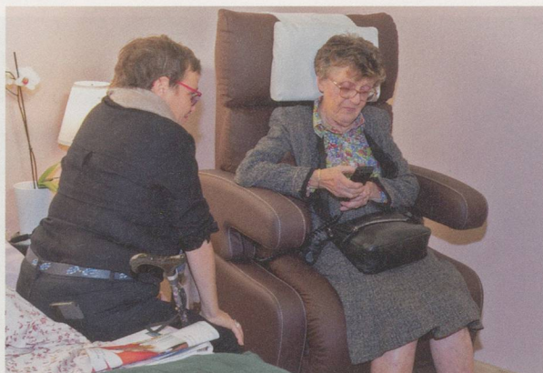
Les patients seront amenés à s'impliquer dans leur prise en charge via des applications mobiles.

Près de 32 000 visiteurs se sont rendus à la troisième édition du salon suisse dédié à la santé, selon un communiqué. La manifestation accueillait, du 4 au 7 octobre, plus de nonante exposants entre les murs de Palexpo, à Genève. A travers des expériences interactives en tous genres, le public a eu la possibilité de se mettre dans la peau d'un cardiologue, d'un médecin légiste ou d'un chirurgien. Tout un chacun a aussi pu découvrir les enjeux de la santé personnalisée, évaluer sa sensibilité à la douleur ou encore tester son taux de glycémie, voire son risque de diabète. Près de cent conférences ainsi que de nombreux films figuraient au programme de cette édition 2018. Tout au long de la manifestation, divers thèmes touchant à la santé ont été abordés, allant de la gestion au quotidien de la maladie et des addictions, en passant par la recherche, la prévention, l'alimentation ou les nouvelles technologies. La prochaine édition de Planète Santé est déjà agendée. Elle aura lieu à Martigny (au CERM), du 14 au 17 novembre 2019.