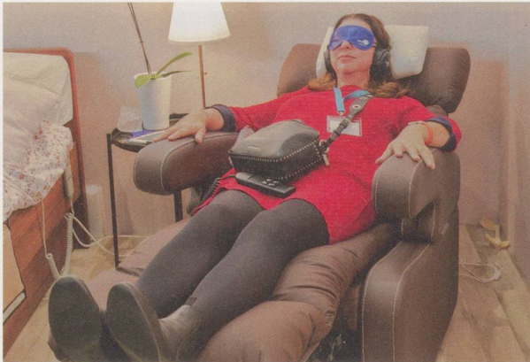
L'innovation pourrait contribuer au bien-être des soignants, mais aussi des soignés.

personnalisé, agréable et familial. L'idée? Renforcer l'autonomie et la sécurité de la personne en convalescence au moyen de la technologie. Son suivi se ferait par la collecte de données en temps réel (poids, tension, saturation de l'oxygène dans le sang, nombre de pas, qualité de l'air de la chambre, etc.). En cas de besoin, elle pourrait contacter son médecin pour une consultation en vidéo-conférence. Ses chaussures seraient en outre pourvues d'un système qui enverrait une alerte géolocalisée à ses proches en cas de chute.