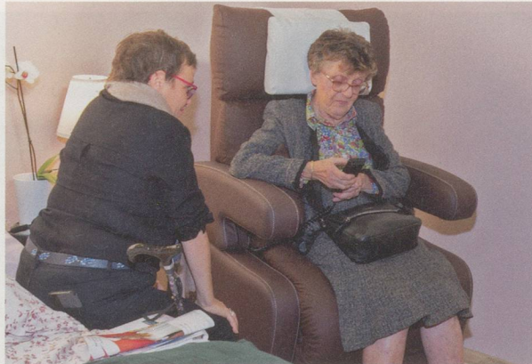
Les patients seront amenés à s'impliquer dans leur prise en charge via des applications mobiles.

Près de 32 000 visiteurs se sont rendus à la troisième édition du salon suisse dédié à la santé, selon un communiqué. La manifestation accueillait, du 4 au 7 octobre, plus de nonante exposants entre les murs de Palexpo, à Genève. A travers des expériences interactives en tous genres, le public a eu la possibilité de se mettre dans la peau d'un cardiologue, d'un médecin légiste ou d'un chirurgien. Tout un chacun a aussi pu découvrir les enjeux de la santé personnalisée, évaluer sa sensibilité à la douleur ou encore tester son taux de glycémie, voire son risque de diabète. Près de cent conférences ainsi que de nombreux films figuraient au programme de cette édition 2018. Tout au long de la manifestation, divers thèmes touchant à la santé ont été abordés, allant de la gestion au quotidien de la maladie et des addictions, en passant par la recherche, la prévention, l'alimentation ou les nouvelles technologies. La prochaine édition de Planète Santé est déjà agendée. Elle aura lieu à Martigny (au CERM), du 14 au 17 novembre 2019.