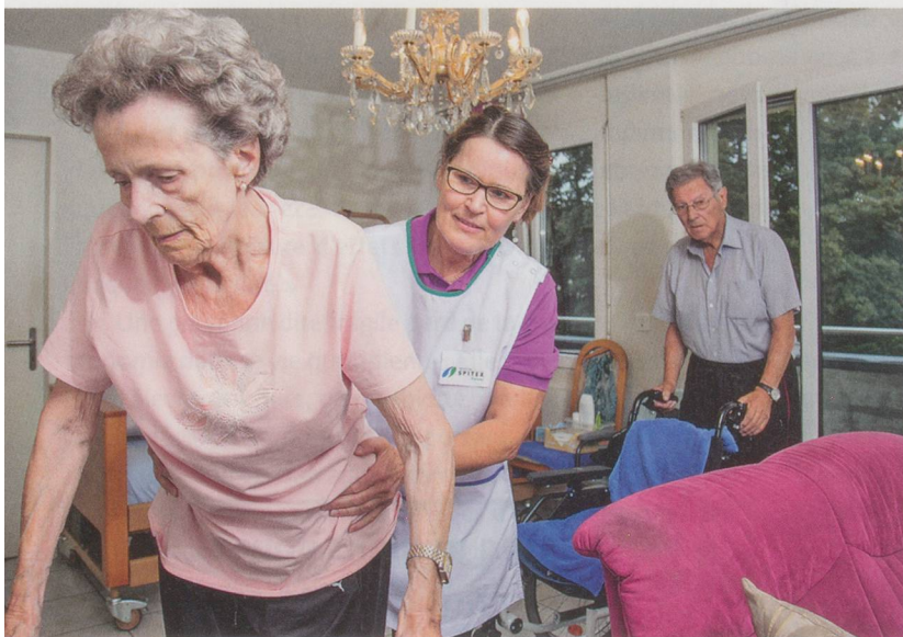
Toute situation perçue comme problématique ne conduira pas forcément à l'émission d'un avis de détresse.

Le personnel qualifié des services d'aide et de soins à domicile est habilité à attirer l'attention de l'autorité de protection de l'enfant et de l'adulte (APEA) sur la vulnérabilité éventuelle de certains de leurs clients. Une étude de la Haute école spécialisée du nord-ouest de la Suisse essaie de déterminer qui dénonce quoi ou pourquoi on préfère ne pas agir.