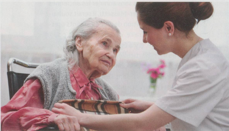
Les projets améliorent la gestion du stress et des compétences.

La pénurie de personnel dans les professions de santé constitue un défi majeur pour le système de santé suisse. D'ici à 2030, les effectifs d'infirmiers et d'infirmières, qui représentent la plus importante catégorie professionnelle du secteur de la santé, seront en déficit de 65 166 personnes, principalement dans les soins de longue durée ainsi que dans l'aide et les soins à domicile (ASD).