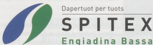
Ci-dessus, le nouveau logo avec un exemplaire par langue

Le nouveau logo se compose de la figure elliptique bleue et verte, du slogan – en français «Pour vous – chez vous», du nom de l'organisation inscrite en majuscule ainsi que la mention du lieu où elle est active écrite en dessous.