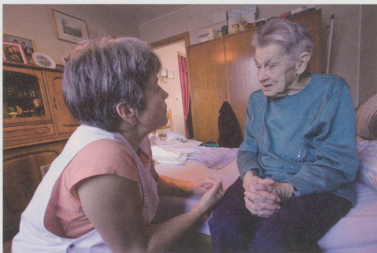
L'ASD d'utilité publique emploient 35 500 personnes en Suisse.

L'obligation de prise en charge des services d'ASD d'utilité publique implique d'autres différences notoires avec les organisations à but lucratif. Alors que dans le domaine des soins de longue durée, les organisations d'utilité publique maintiennent une moyenne de 52 heures par client (55h pour 2014), le secteur privé comptabilise 105 heures par client, un chiffre identique à l'année précédente.