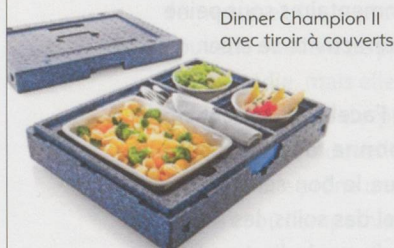
Dinner Champion II avec tiroir à couverts

En très bon état, idéal pour la livraison de repas chauds ou froids.