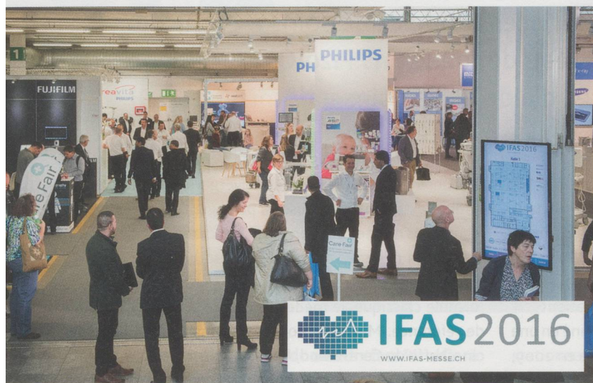
Exposants, CareFair, exposition spéciale et le Forum – les visiteurs du salon IFAS 2016 étaient très satisfaits.

L'IFAS, le salon spécialisé du marché de la santé, reste un point de rencontre.