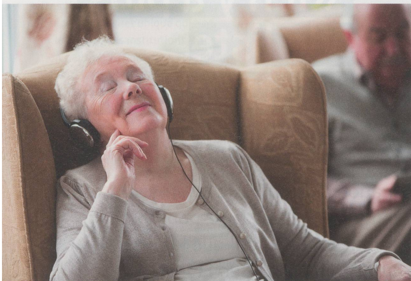
Pouvoir vivre à domicile aide les personnes atteintes de démence

Toujours plus de personnes souffrent de démence. La journée de formation qui aura lieu le 9 mars prochain à Olten s'intéressera aux nombreux défis à relever pour faire face aux maladies démentielles et montrera comment les soins à domicile peuvent s'y préparer.