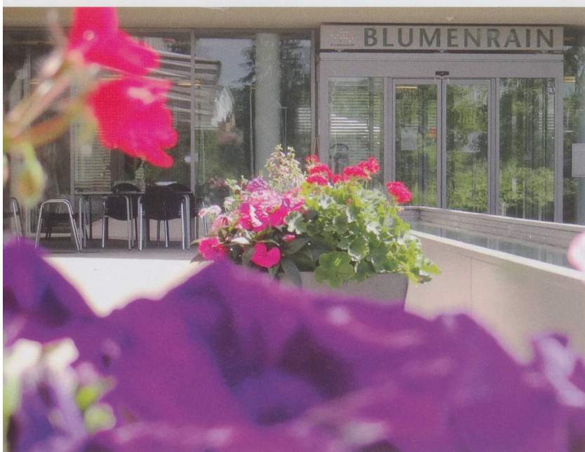
Des soins intégrés faisant fi des frontières cantonales, l'institution Blumenrain a réalisé ce projet dans la région bâloise et au-delà.

La fondation bâloise Blumenrain collabore étroitement avec des homes, des appartements médicalisés, les services d'aide et de soins à domicile ainsi qu'avec des centres de jour pour seniors. Une offre qui dépasse volontiers les limites du canton.