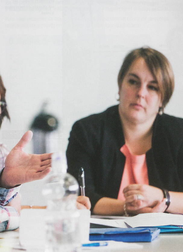
La séance d'accueil des nouveaux collaborateurs imad fait partie des dispositifs de formation et a lieu chaque mois.

Expertise, conseil et service personnalisé pour tous vos besoins en matériel de bureau. Nous sommes votre partenaire idéal.