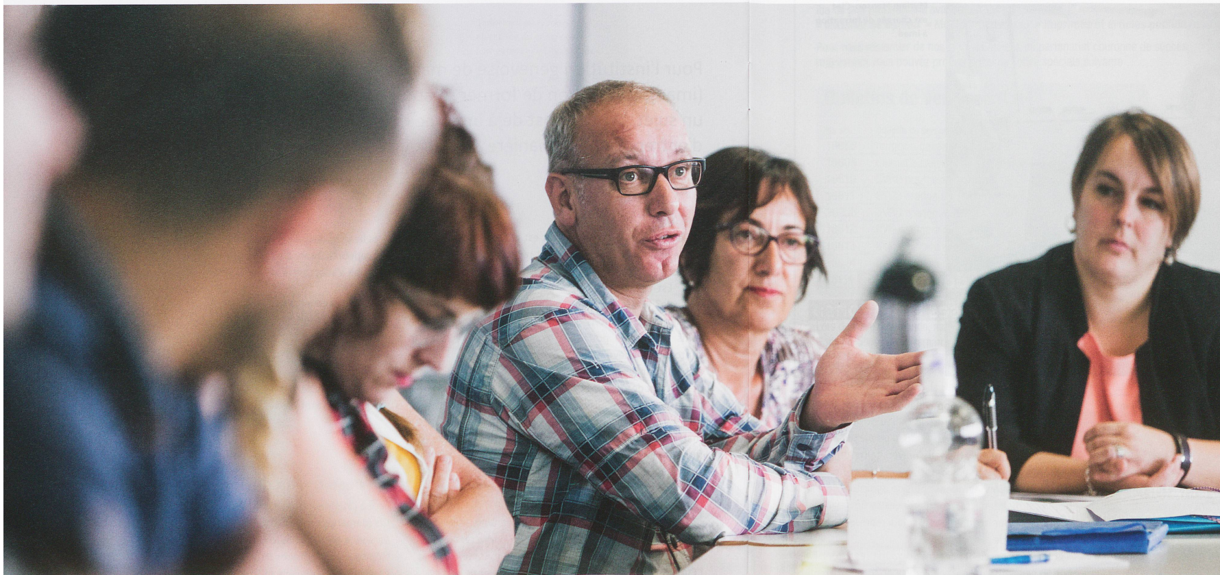
La séance d'accueil des nouveaux collaborateurs imad fait partie des dispositifs de formation et a lieu chaque mois.

tion des ressources humaines et de formation, elle doit pouvoir les intégrer dans la politique cantonale et s'appuyer sur un système de formation réactif», précise, à ce sujet, Sandrine Fellay Morante.