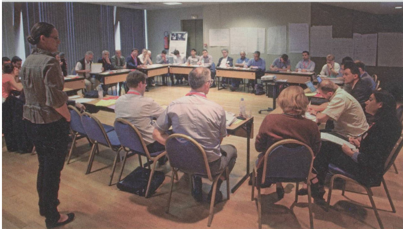
En 2014 déjà, InnovARC avait organisé 24 heures d'ateliers sur le thème «l'innovation dans la mobilité».

red. InnovARC réunit plus de 250 entreprises, laboratoires et collectivités de l'Arc jurassien franco-suisse. Ce réseau