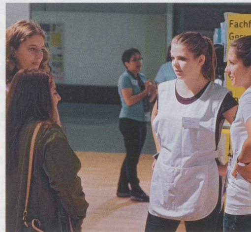
SwissSkills, édition 2014. Les organisateurs comptent sur une participation massive des milieux de l'aide et des soins à domicile en 2016.

En effet, les organisations du monde du travail souhaitent reconduire l'expérience très positive des SwissSkills Berne 2014 et mettre sur pied des championnats nationaux tous les deux ans. Les personnes souhaitant participer à la finale suisse doivent préalablement s'imposer dans les épreuves régionales. Elles trouveront toutes les informations sur le lieu et les dates de ces