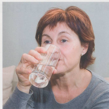
Boire beaucoup d'eau: cette règle n'est pas valable pour tout le monde.