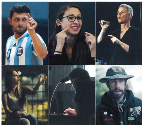
Hear my Story: sechs eindrückliche Porträts.

Alle Filme sind online verfügbar: www.hearmystory.ch