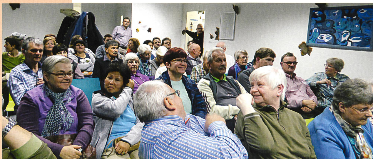
Mit grossem Interesse verfolgen die Besucherinnen und Besucher die Beiträge der verschiedenen Referenten.