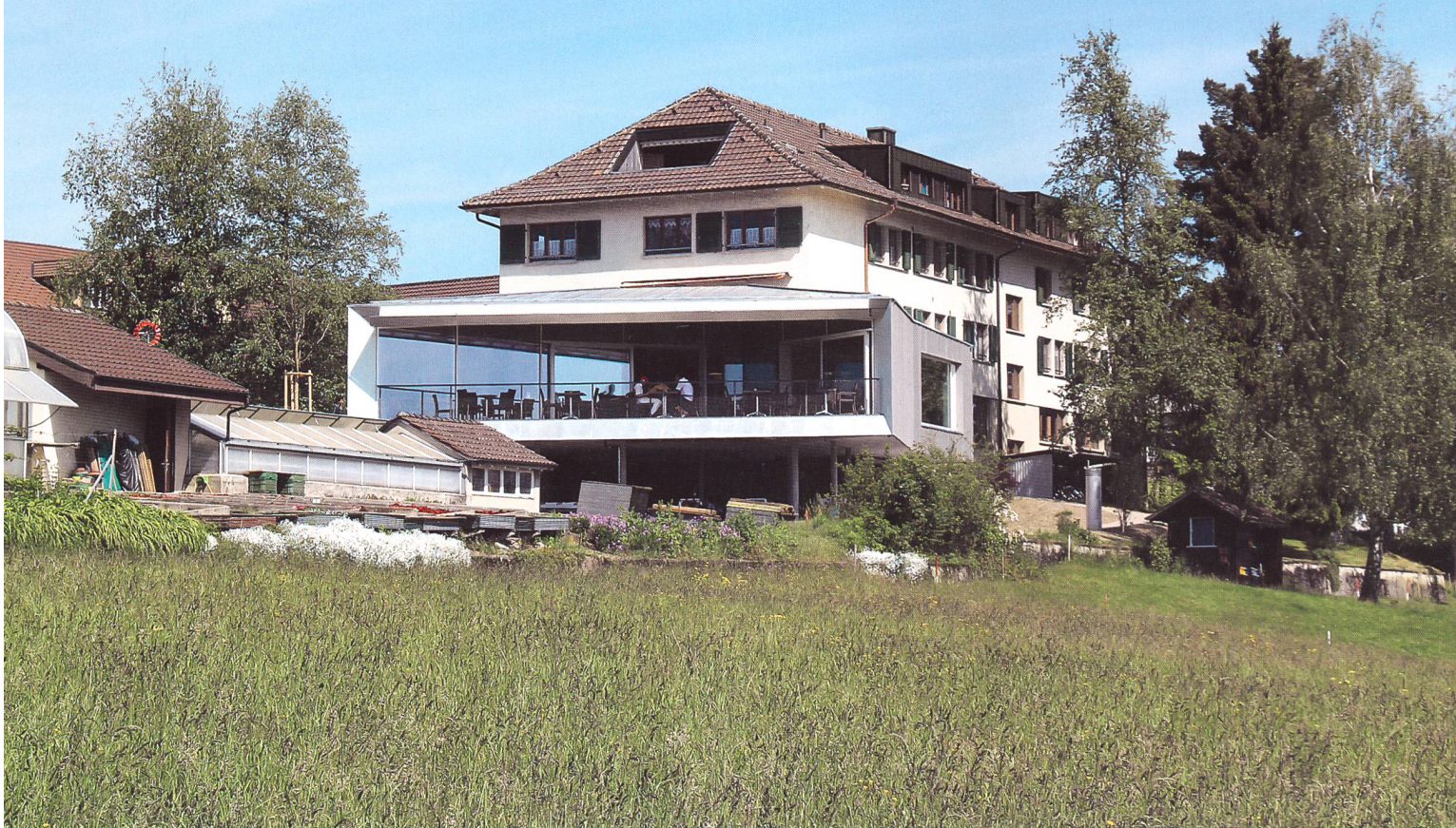
Das neu gebaute Restaurant Alpenblick mit Terrasse und Aussicht auf das Alpenpanorama.