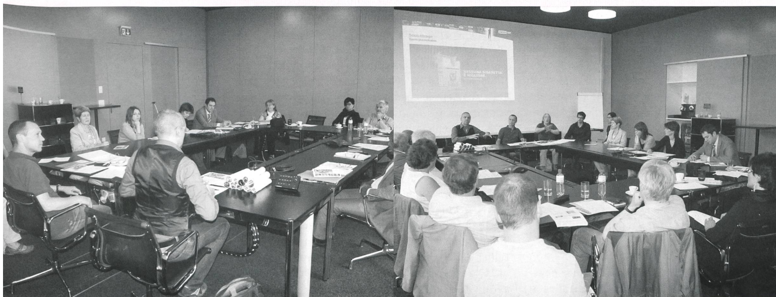
Interessiert folgen die Teilnehmenden den spannenden Ausführungen.