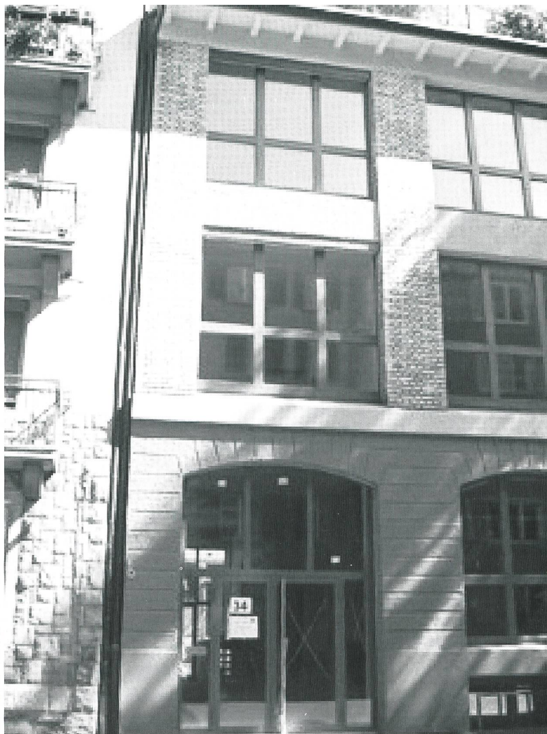
Eingang zur Praxis an der Pflanzenschulstrasse 34 in Zürich

Die Sport-Massage spezialisiert sich auf eine vertiefte Behandlung des Bewegungsapparates und ermöglicht eine physikalische Lockerung und Kräftigung.