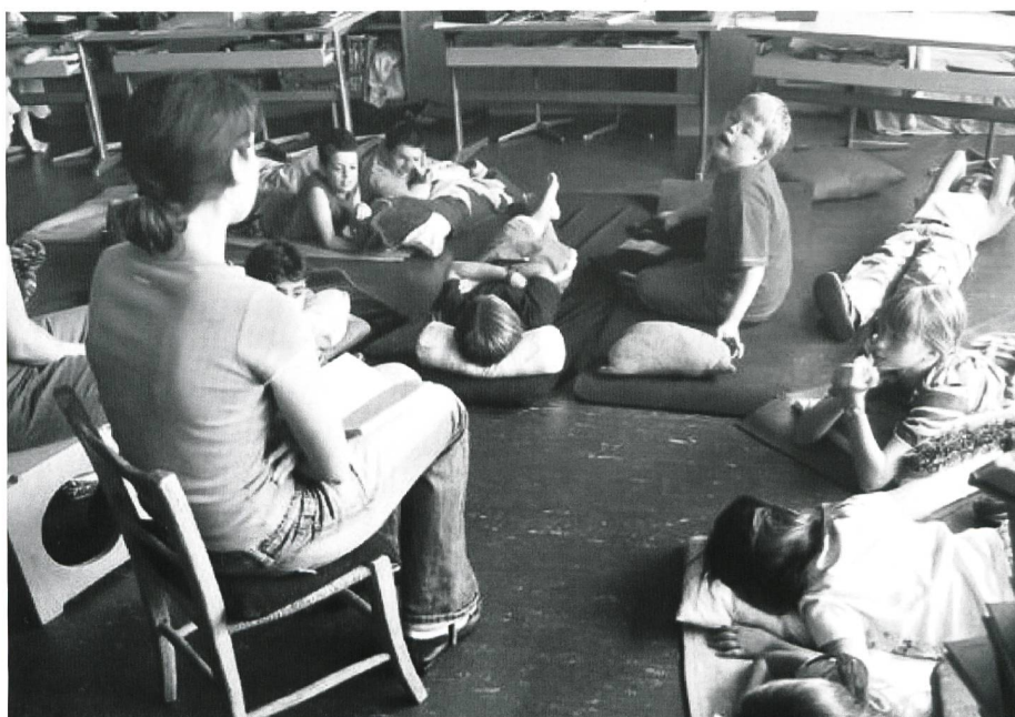
Unterricht in einer „normalen“ Klasse in Basel: In dieser 3. Primarklasse sind drei Kinder geistig behindert.

Zum Kampf gegen den integrativen Unterricht bläst nun auch die SVP. Deren bildungspolitische Vordenker, Nationalrat Ulrich Schlüer, erklärt die Integration für gescheitert, bevor sie in Zürich richtig