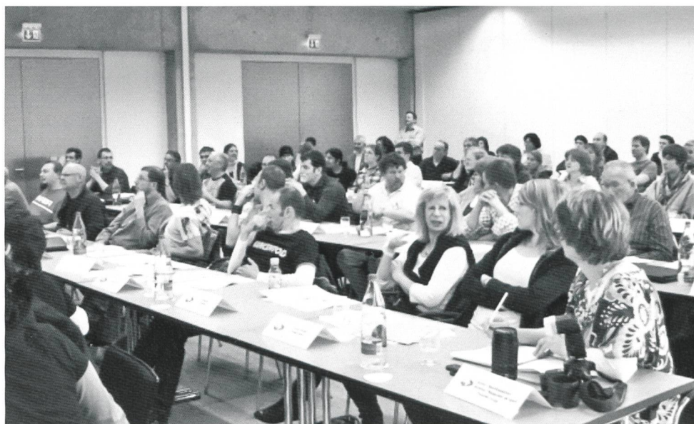
Gespannt verfolgen die Delegierten die Jahresversammlung.