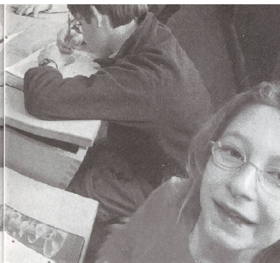
Kinder mit Lernschwierigkeiten oder Behinderungen sollen, wenn möglich, in Regelklassen geschult werden.

Die eher schlechte Note dürfte damit zusammenhängen, dass die Reform einen fundamentalen Wechsel darstellt, der Unsicherheiten auslöst. Künftig werden Kinder mit Schulschwierigkeiten nämlich nicht mehr in Sonderklassen eingeteilt, sondern unter dem Titel „integrative Förderung“ in die Regelklasse integriert. Dort werden sie zwar von einer schulischen Heilpädagogin regelmässig unterstützt, folgen sonst aber dem normalen Schulunterricht. Sonderklassen zu bilden, ist zwar weiterhin erlaubt, doch weil der Kanton die Anzahl Lehrerstellen den Gemeinden fix zuteilt, sind die personellen Möglichkeiten sehr begrenzt. Wie Urs Meier vom Volksschulamt erklärt, bringt das die