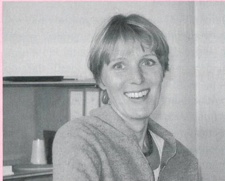
sowie Politik und Gesellschaft.

Die Vielfalt der angebotenen Ausbildungslehrgänge der EB Zürich ist beeindruckend. Von Deutschkursen für Deutsch- und Fremdsprachige über Fremdsprachkurse, Management- und Informatikausbildungen bis hin zu Weiterbildungslehrgängen der Persönlichkeits-Entwicklung