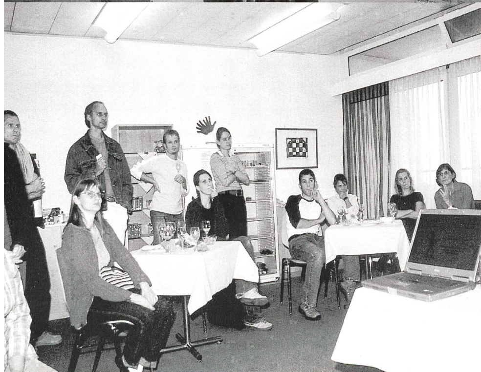
Die informative Abschlussfeier im Gehörlosenzentrum stiess auf reges Interesse.

Die partnerschaftliche Zusammenarbeit zwischen gehörlosen und hörenden Fachleuten im Gehörlosenwesen ist GATiG ein wichtiges Anliegen.