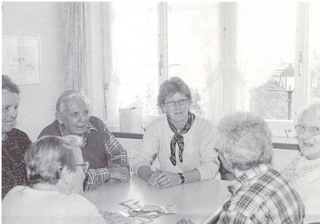
Die Heimleiterin (Mitte) hat immer ein offenes Ohr für die Anliegen der Pensionäre.