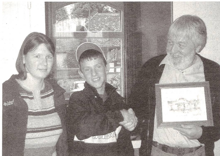
Eine gehörlose Lehrerin und ein Schüler überreichen das Bild ihrer Schule

Nach der Zehnminutenpause begaben wir uns wieder in den Speisesaal. Dort teilten wir den Besuch in Gruppen auf, welche im Anschluss von den verschiedenen Gehörlosenklassen zu einem Unterrichtsbesuch abgeholt wurden. Diese Besuche waren sehr interessant und aufschlussreich, da die multikulturelle Vielfalt der Besucher unsere Schüler zu vielen interessanten Fragen und Gesprächen motivierte. So machte beispielsweise die 7. Gehörlosenklasse Interviews für die Schülerzeitung der Sprachheilschu-