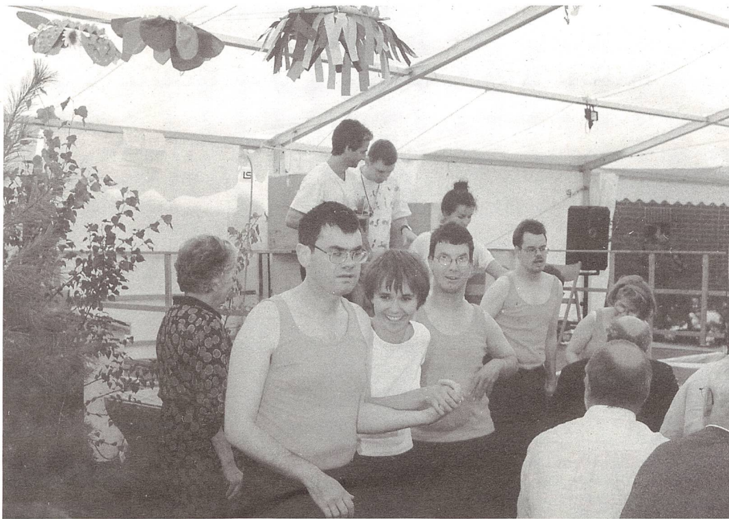
Der Tannechor – bestehend aus Mitarbeiterinnen und Mitarbeitern – präsentierte dem wohlgelaunten Publikum eingängige Melodien.