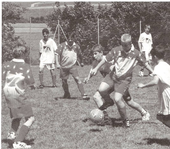
10 deutschschweizer Heime beteiligten sich an der Fussballmeisterschaft in Hohenrain.

Gegen 15.00 Uhr war klar, wer um die ersten Ränge kämpfen durfte. Wer nicht dabei war, feuerte umso heftiger die Final-